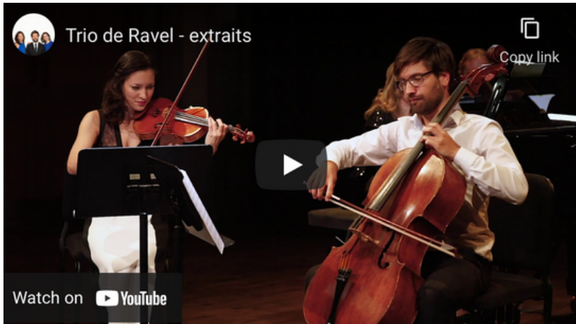
RAVEL TRIO POUR PIANO ET CORDES