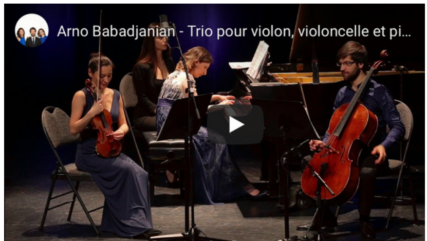
BABADJANIAN TRIO POUR VIOLON, VIOLONCELLE ET PIANO EN FA# MINEUR, II. ANDANTE